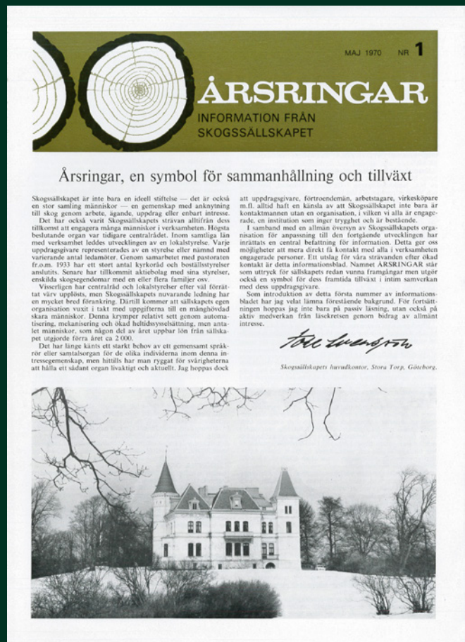
Första "tidningen" från Skogssällskapet kom ut i maj 1970. Fram till mars 2001 hette den Årsringar. Därefter bytte den namn till Skogsvärden.