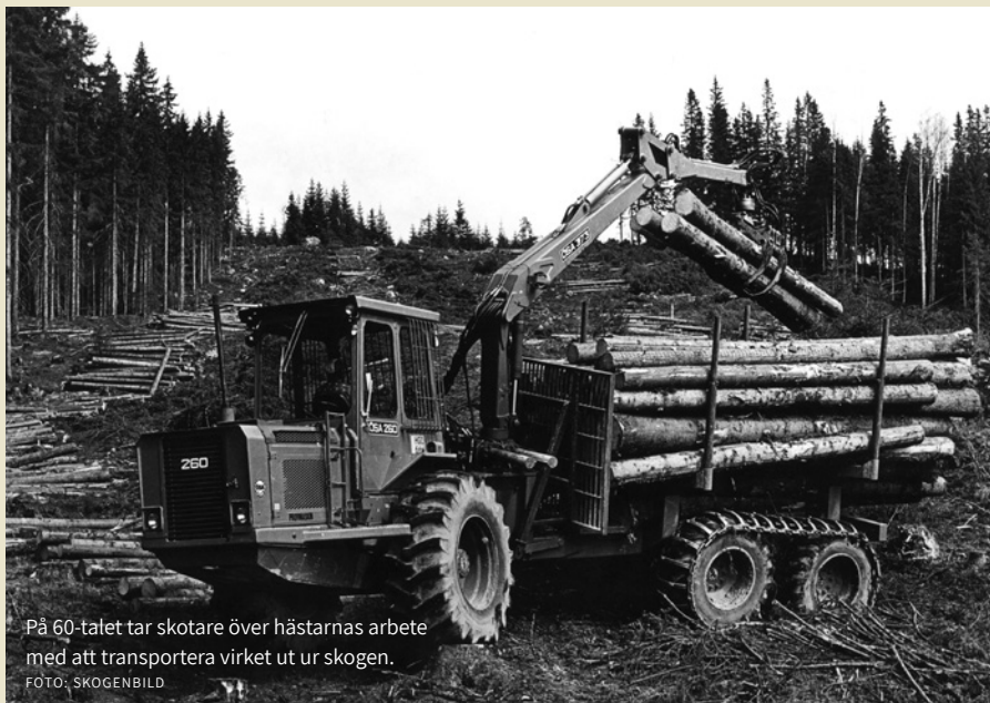
På 60-talet tar skotare över hästarnas arbete med att transportera virket ut ur skogen.