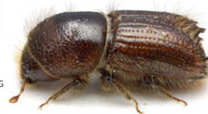
Måste stoppas.

Projektet ”Stoppa borrarerna” planeras att fortgå till och med år 2022. 🌱